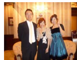
しみデンスタッフもみんなでお祝いしました♪