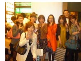
お二人とも末永くお幸せに…♡ 幸せな家庭を築いてください（^-^）