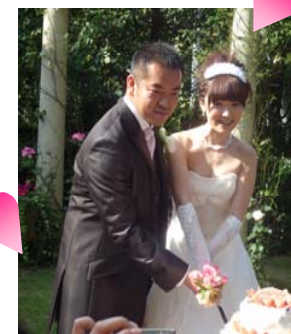
終始ラブラブなお二人♡