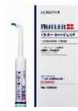
バトラールルートジェル (歯科医院専売)