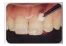
歯科医院ではより効果的なコーティング剤の処置ができます★