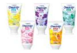
チェックアップジェル (歯科医院専売)